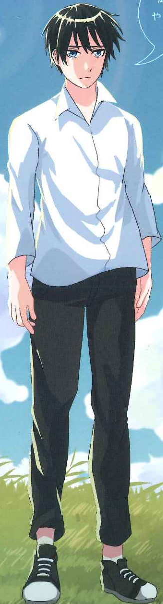
Illustration by 三井万奈

お問い合わせ: 086-251-7501 (岡山大学法学部 濱田研究室) hamada-y@cc.okayama-u.ac.jp